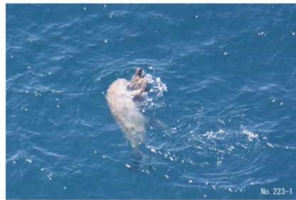
カメと戯れる沖縄ジュゴン

(4) 返信メール中の「Confirm your signature by clicking here.」をクリックして「YOU've successfully～」が表示されたら完了！